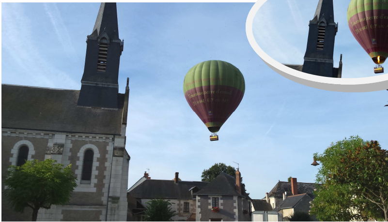
3 septembre 2016, Villeperdue vue d'en haut