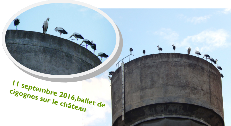
11 septembre 2016, ballet de cigognes sur le château

La Communauté de Communes de Sainte Maure de Touraine propose de nombreux spectacles et animations. Son programme culturel est disponible en mairie ainsi qu'à la bibliothèque.